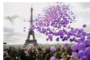
lâcher = to let go